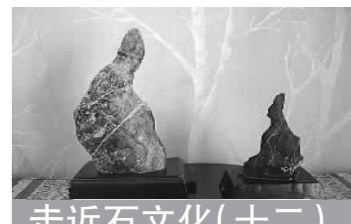
走近丑石文化(十二)