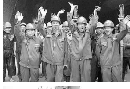
贵广人工工掘进破纪录