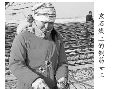
京石线上的钢筋女工