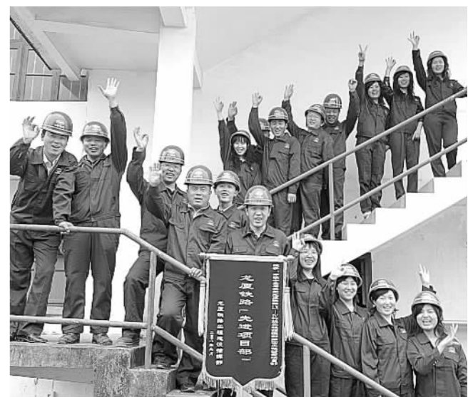
项目干部职工拧成一股绳,成为龙厦铁路建设的领头羊。