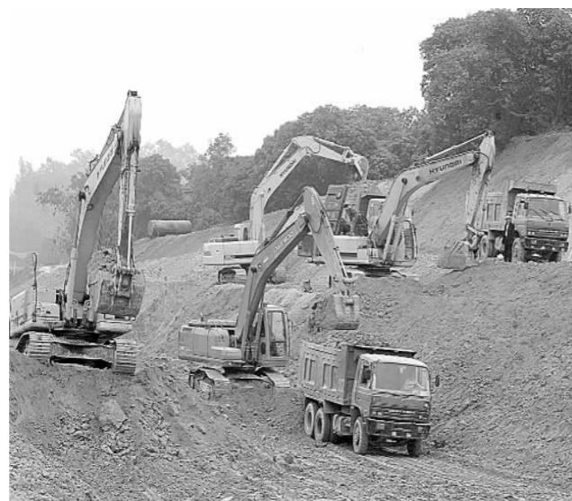
土方开挖多层次作业创高产。