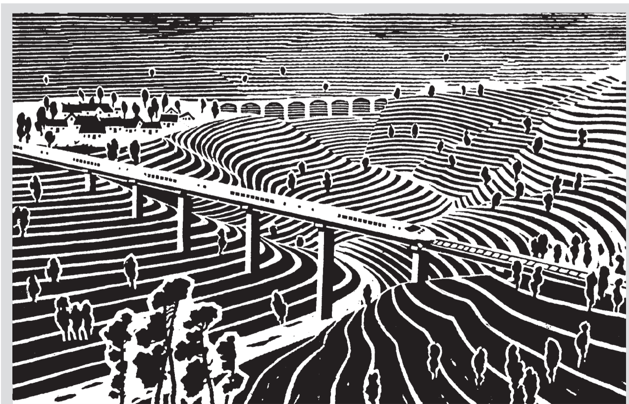
曲线与直线(版画) 莫测/作