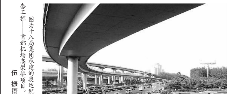
图为十八局集团承建的奥运配套工程——首都机场高架桥项目。

单位 二十局集团四公司 参建工程 胶济客运专线 职务 女工班班长 奥运寄语 2008年北京奥运会,属于中国,也属于世界,能够参与其中,我备感荣幸!我们将向世界展示中国筑路人的形象,建最好的奥运大道!