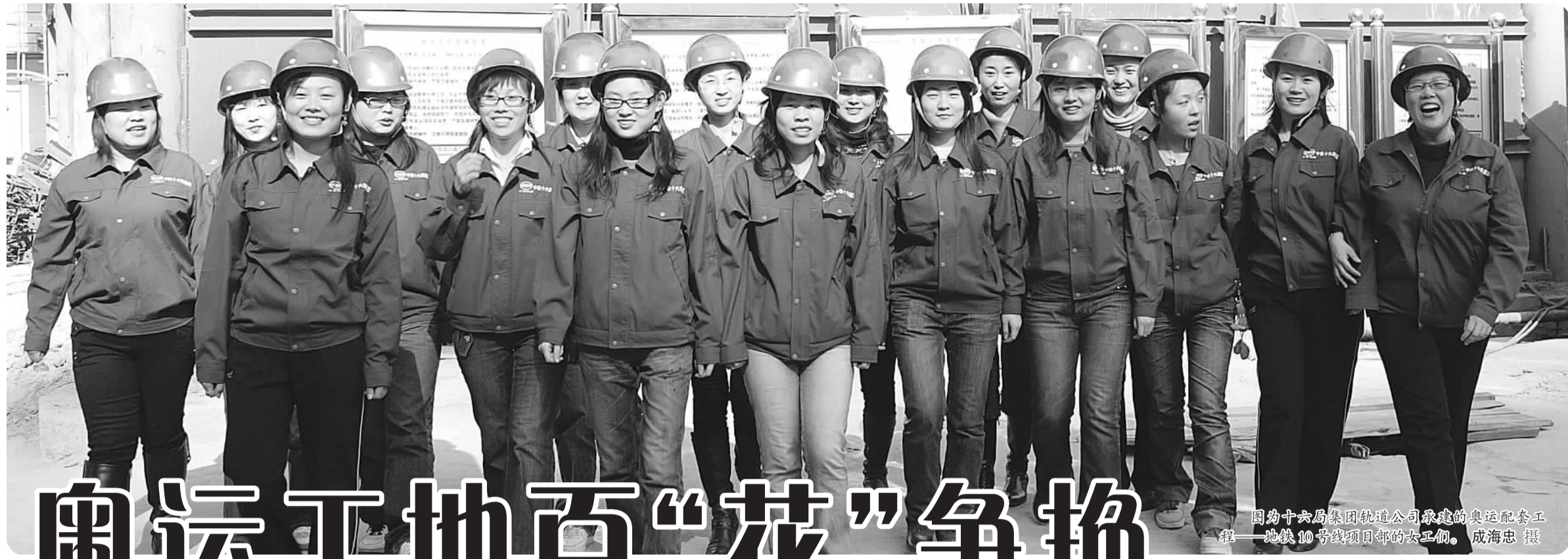
图为十六局集团轨道交通公司承建的奥运配套工程——地铁10号线项目部的女工们。

像奥运健儿那样驰骋在2008年北京奥运会的赛场,在鲜艳的五星红旗下披金戴银,为国争光,是无数国人的梦想。然而,能把这一梦想变为现实的,毕竟只是极少数最优秀的运动员。 在我们身边,就有一群与奥运结缘的女性。她们虽不能参与竞赛场上的角逐,却在奥运的另一个赛场上,把知识和信念,化为一座座精美的建筑,向世界展示着中华建筑人的聪明才智,同样实现了奥运之梦。她们就是奥运工程的建设者。值此“三八”妇女节来临之际,让我们走近她们,共同品味她们圆梦奥运的酸甜苦辣吧! ——编者